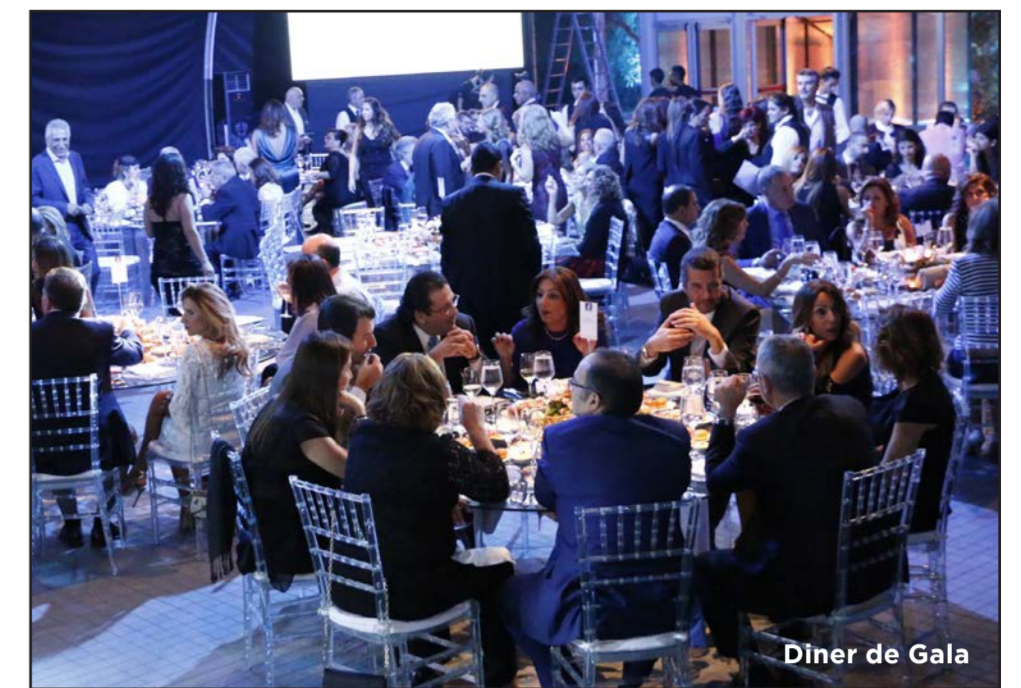
Dîner de Gala