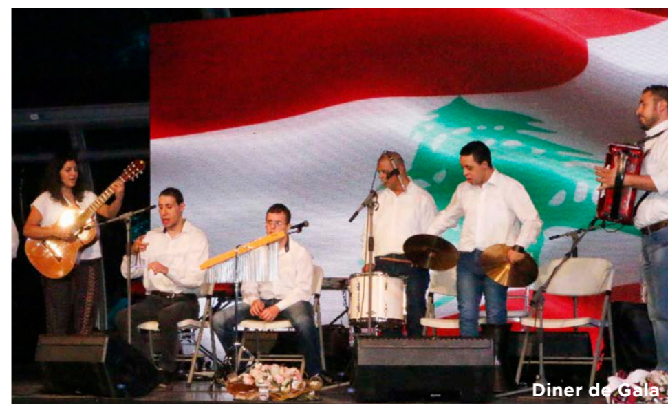
Dîner de Gala